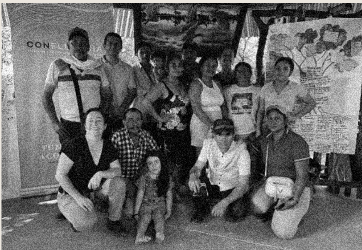
Encuentro diálogo de saberes con líderes y lideresas de la Confluencia en el municipio de Vistahermosa, Meta.

Dentro de los principales logros se cuenta la consolidación de un documento de insumos y recomendaciones que fueron incorporados en el séptimo informe de seguimiento, el establecimiento de contacto entre funcionarios de la Procuraduría Delegada para el seguimiento a casos específicos de implementación del PNIS y la ampliación de información en la Confluencia sobre el rol de la Procuraduría en la vigilancia del cumplimiento del Acuerdo de Paz.