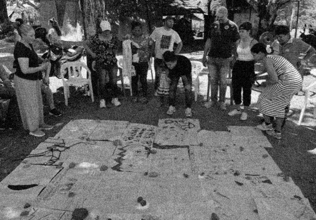
Primer espacio de fortalecimiento de los procesos de veeduría comunitaria en el sur del Tolima