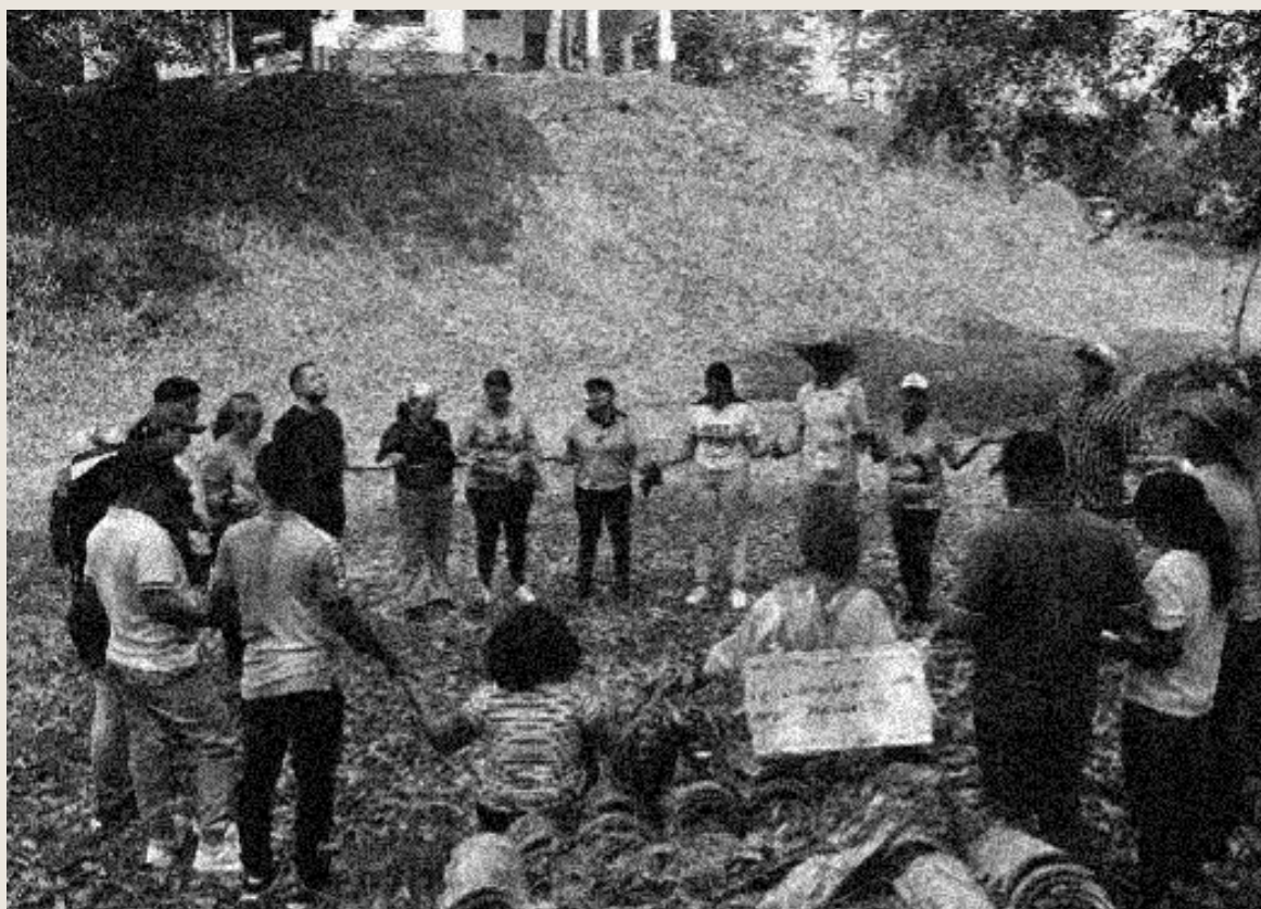
Primer espacio de fortalecimiento de los procesos de veeduría comunitaria en el sur de Bolívar

Desde abril de 2025 se activó una agenda de fortalecimiento de capacidades comunitarias en el municipio de Vistahermosa (Meta), núcleo veredal La Cooperativa, para validar desde la visión comunitaria el valor agregado de iniciativas de este tipo e identificar elementos para nutrir el concepto de los acuerdos comunitarios de construcción de paz y protección ambiental, a partir de una agenda de fortalecimiento de capacidades asociativas en el sector.